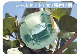
シールセット(大)張付け例

大型柿の太天・太月にはシールセット(特大)を2セット※1を使い、果実の両側面に貼り付けることで脱渋効果を高めます。